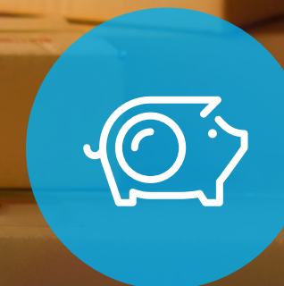
Einsparungen bei Frankierung und Versand